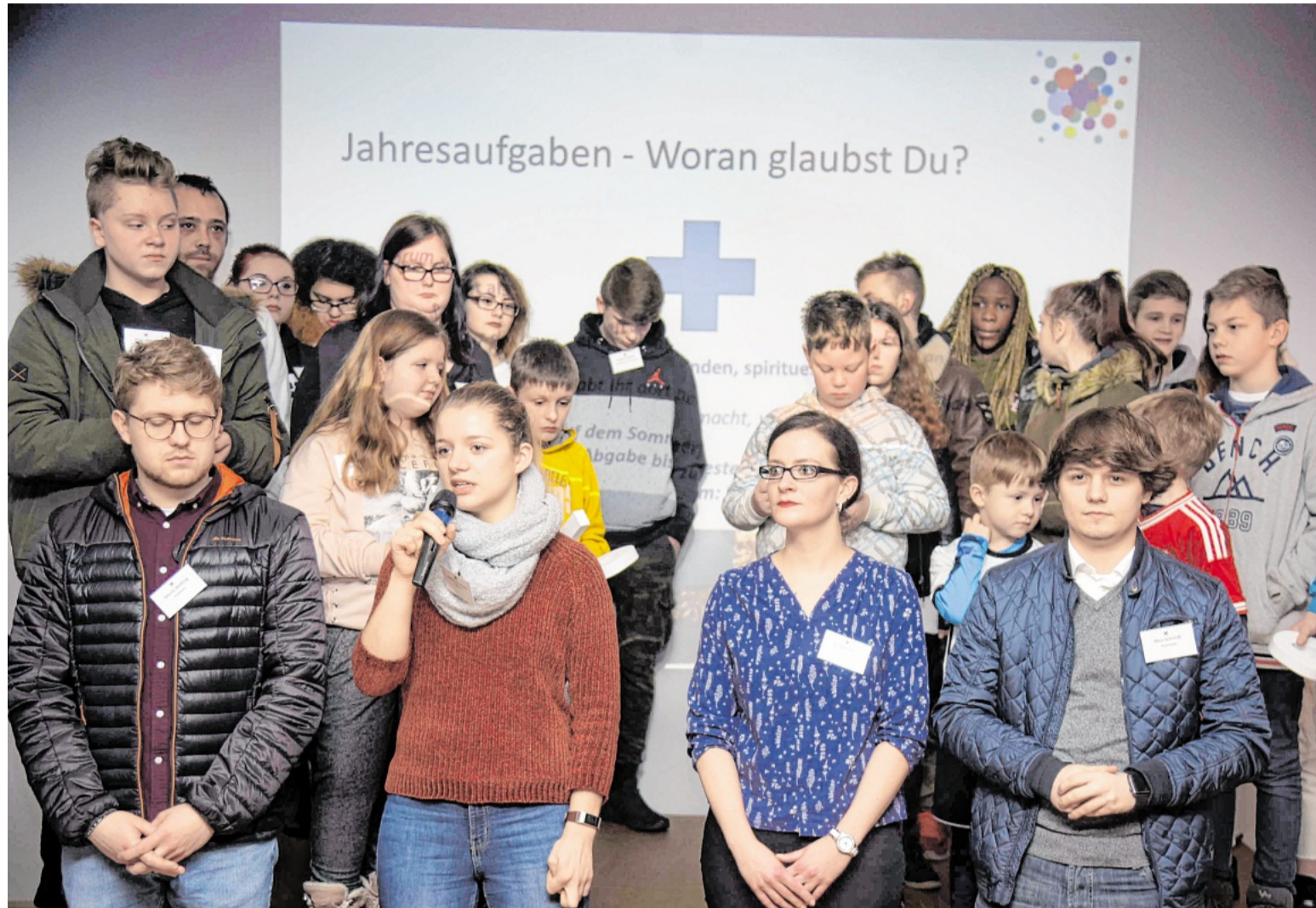
Vier Projektpaten haben sich auf dem Jahresempfang vorgestellt, sie begleiten ehrenamtlich Gruppen.